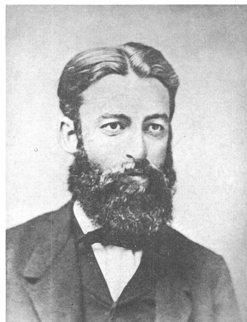
Lothar Meyer

gewichtet». 1876 folgte er abermals einem Ruf, diesmal an die Universität Tübingen, wo er 1894 Rektor wurde. 1890 erschien sein Werk «Grundzüge der theoretischen Chemie».