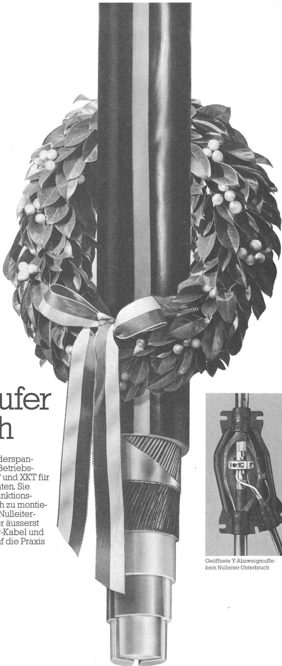
Geöffnete Y-Abzweigmuffe: kein Nulleiter-Unterbruch

Elektrische Kabel Drahtseile FLEXWELL-Fernwärmeleitungen