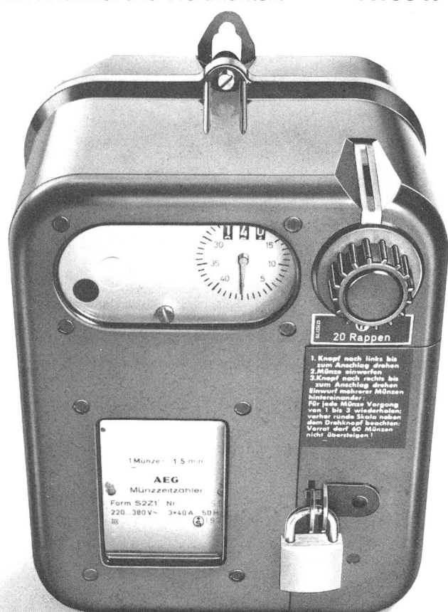
AEG Münzschaftautomaten – Zählen und Kassieren nach Mass.

...Trocknungsanlagen, Kegelbahnen, in Beleuchtungsanlagen, Saunas oder Solarien ermöglichen AEG Münzschaftautomaten einfaches Einziehen fälliger Kosten. Und das mit einem Zählwerk nach Mass. In elf Laufzeiten zwischen 8 und 80 Minuten. Für Zäner, Zwänzger und Fünfzger. Oder Fränkler, Zweifränkler und Wertmarken. Fr. 354.-