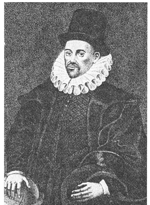
Physikalisches Institut der ETH (Zürich-Höngrgerberg)

Neben seinen Arbeiten auf dem Gebiete der Physik werden ihm auch einige astronomische Berichte zugeschrieben. Gilbert starb am 10. Dezember 1603 in London und wurde in der Dreieinigkeitskirche zu Colchester beigesetzt. Er war unverheiratet und hat seine Werke und Globen dem Ärzte-College in London vermacht. Dort gingen sie während der Pestzeit (1665) und beim Brand von London (1666) unter.