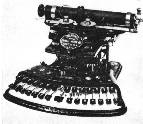
Eine der ersten Kugelkopf- Schreibmaschinen Marke CRANDAL, Baujahr 1879, USA, aus dem Museum Baggenstos AG

Bald 100 Jahre Kugelkopf-Schreibmaschinen. Blättert man in der Schreibmaschinengeschichte einige Jahrzehnte zurück, stellt man erstaunt fest, dass bereits im letzten Jahrhundert Schreibmaschinen-Modelle mit Kugelkopf existierten. Namen wie Edison, Mignon oder Blickensderfer und Crandal waren vor hundert Jahren Wegbereiter der Kugelkopf-Schreibmaschine. In einer Zeit übrigens, in der man der Schreibmaschinen-Entwicklung gar manchen Stein in den Weg legte. So liessen zum Beispiel