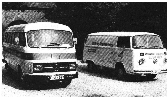
Elektrotransporter für eine Nutzlast von 0,8 resp. 1,4 t, 70 km/h Höchstgeschwindigkeit und einer Reichweite von etwa 60 km

In der Bundesrepublik Deutschland läuft unter der koordinierenden Leitung der Gesellschaft für elektrischen Strassenverkehr (GES) seit mehreren Jahren ein zum Teil staatlich gefördertes Versuchsprogramm, an dem alle interessierten Industriezweige teilnehmen. Über 100 Elektrobusse, Hybrid-Elektrobusse und Elektrotransporter werden zurzeit im praktischen Einsatz getestet. Damit lassen sich alle technischen und betrieblichen