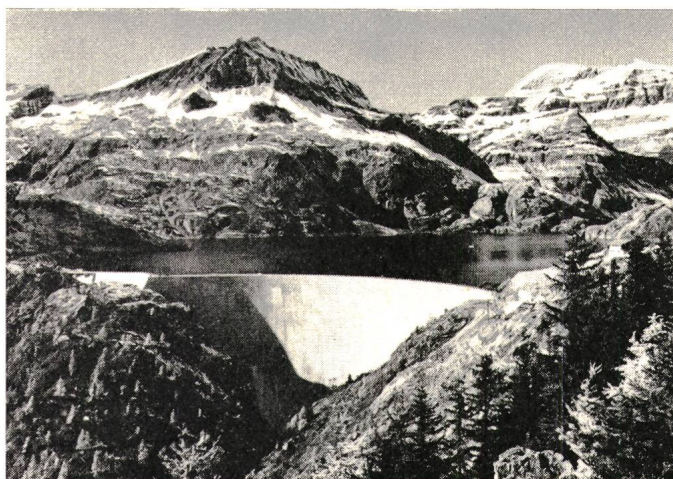
Staumauer und Stausee Emosson

Die Erstellung eines solchen Werkes, das die Grenzen von zwei souveränen Staaten überschreitet, setzt nicht nur viele gegenseitige Einsichten und viel Verständnis voraus. Wir haben hier nicht Mauern errichtet, die trennen, sondern solche, die