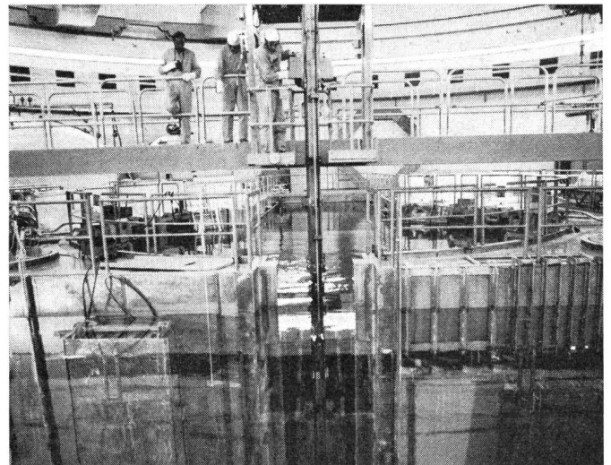
Fig. 1 Echange de combustible: plate-forme de manipulation de la machine à échanger les éléments de combustible.

La centrale nucléaire de Mühleberg, des Forces Motrices Bernoises (FMB), a été arrêtée le 1 er août pour permettre le remplacement des éléments de combustible et procéder aux tra-