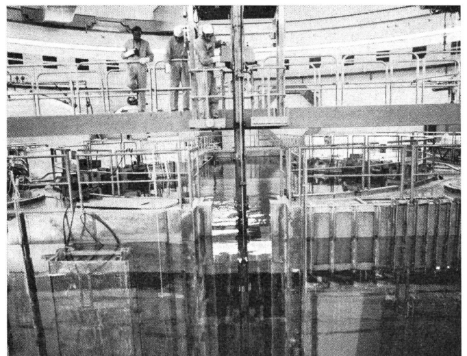
Fig. 1 Echange de combustible: plate-forme de manipulation de la machine à échanger les éléments de combustible.

La centrale nucléaire de Mühleberg, des Forces Motrices Bernoises (FMB), a été arrêtée le 1er août pour permettre le remplacement des éléments de combustible et procéder aux tra-