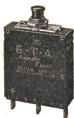
Reihe 834-P-Si Halbleiterschalterschalter mit magnetischer Schnellauslösung