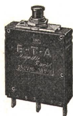
Reihe 834-P-SI Halbleiterschutzschalter mit magnetischer Schnellauslösung