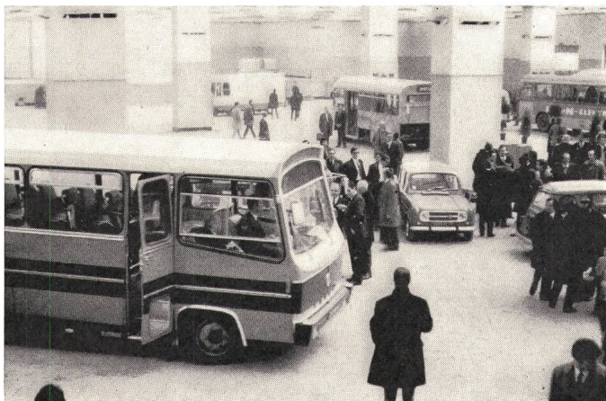
Studientagung über Elektrofahrzeuge 1972 in Brüssel: Blick auf das Ausstellungsgelände