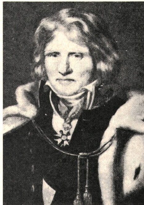
«La Houille Blanche», Grenoble

Berichtigung. Nachstehend seien einige Richtigstellungen bzw. Ergänzungen zu den Kurzbiographien von H. Wüger gegeben: