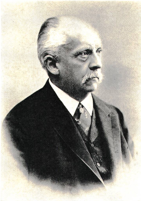
Deutsches Museum München

Hermann Helmholtz zählt zu den grossen Physikern. Sein Knabenwunsch, Naturwissenschaften zu studieren, konnte ihm sein Vater der hohen Kosten des Studiums wegen nicht erfüllen. Wie Werner Siemens musste er daher eine Militärschule besuchen, an der der Unterricht kostenlos erfolgte. An der Militärärztschule studierte er Medizin und wirkte dann eine Zeitlang als Militärarzt. Vom Physiologieprofessor Joh. Müller angeregt, stellte er Untersuchungen an über den Zusammenhang zwischen Arbeitsleistung und Wärmeentwicklung im Tierkörper, etwas also, worüber der Arzt Rob. Mayer (1824) und Joule (1843) bereits geschrieben hatten, deren Arbeiten Helmholtz aber nicht gekannt hatte. Im Juli 1847 berichtete er in der Physikalischen Gesellschaft in Berlin darüber. Sein Verdienst bestand darin, dass er die Zusammenhänge physikalisch klar herausstellte.