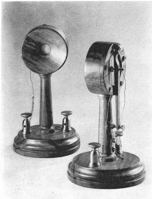
Deutsches Museum, München

Das erste Mikrophon, abgesehen von dem immerhin interessanten physikalischen Versuch von Reis 1861, hat wohl Edison noch kurz vor Hughes gebaut. Allerdings hat er die Wirkungsweise im Gegensatz zu diesem nicht richtig gedeutet.