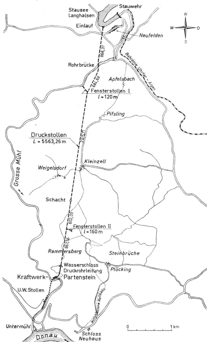
Fig. 1 Übersichtplan Druckstollen Langhalsen—Partenstein

ten Auskleidung beträgt 15 cm. An Stellen, an denen das Gebirge weniger standfest erschien, wurden bewehrte Ringe aus Torkretbeton eingezogen, deren lichter Durchmesser nur 2,80 m beträgt. Während der übrige Beton schalrein blieb,