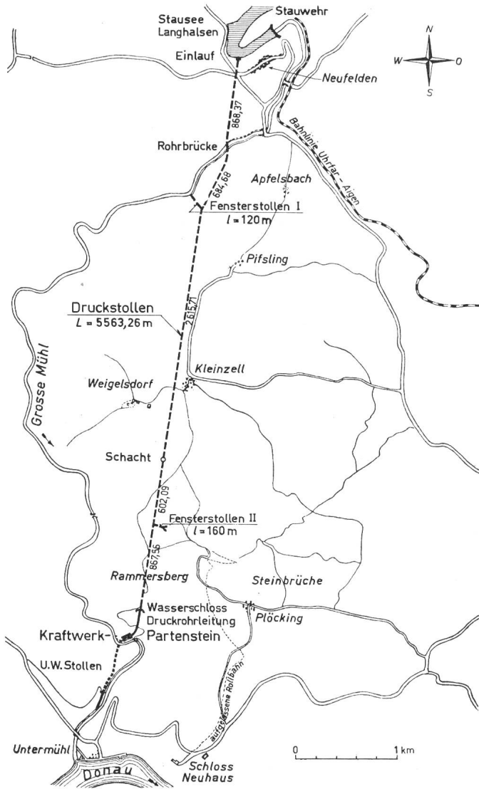
Fig. 1 Übersichtsplan Druckstollen Langhalsen—Partenstein

wurde der Torkret geglättet. Der statische Innendruck bei Vollstau beträgt vom Einlauf bis zur Rohrbrücke 10 bis 16 m und nach der nach der Rohrbrücke stärker fallenden Strecke bis zum Wasserschloss zwischen 27 und 40 m. Bei der bis 1963 gefahrenen max. Betriebswassermenge von 24 m 3 /s betragen die Wassergeschwindigkeiten 3,5 bzw. in den Torkretungen 3,9 m/s.