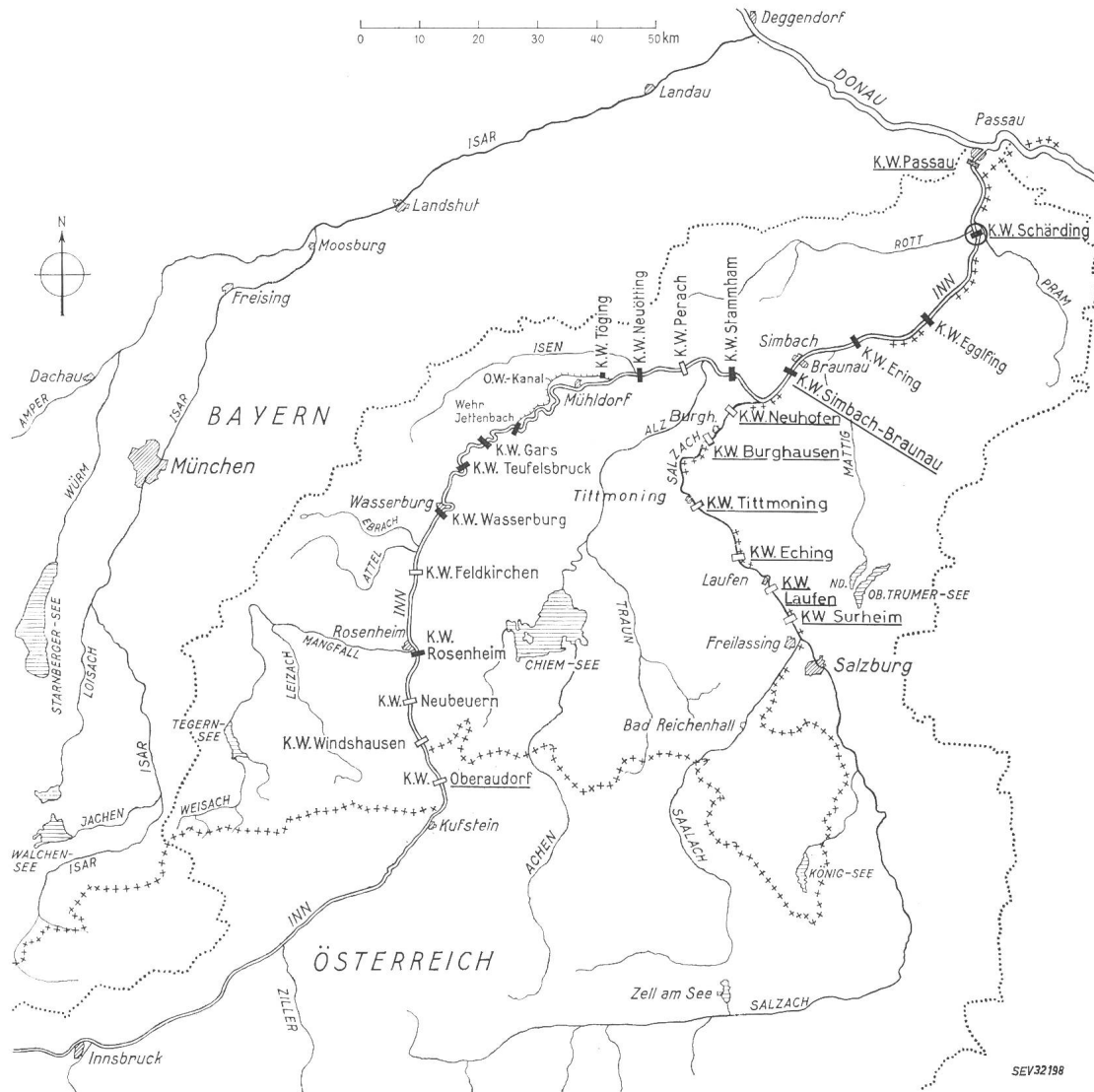
Fig. 1 Situationsplan

Das Flusskraftwerk Schärding-Neuhaus (Fig. 2) [1] 1) , vorletztes in dieser Kette von insgesamt fünf Kraftwerken