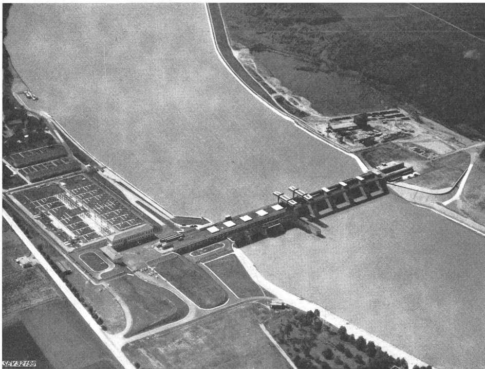
Fig. 2 Luftaufnahme des Flusskraftwerkes Scharding-Neuhaus

Das Maschinenhaus, seine Anbauten und die Wehranlage sind wie die Kraftwerke am oberen Inn — von der Innwerk AG Töging errichtet — in Flachbauweise gebaut und lehnen sich in der konstruktiven Gestaltung eng an die nahezu gleich grosse Innstufe Simbach-Braunau [2] an. Die Anlage staut den Fluss 10,70 m über das