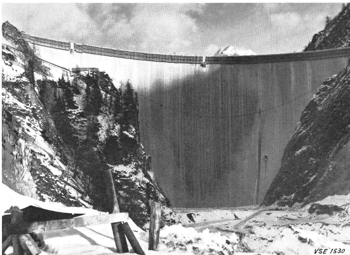
Staumauer Luzzone, Oktober 1962