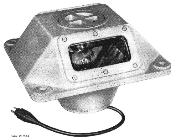
Fig. 1 Bodenfeuer

1. Bodenfeuer (Typ BOF 36) . Dieses Feuer schliesst plan mit der Erdoberfläche ab und stellt für das Flugzeug kein Hindernis beim Überrollen dar. Der Glaskörper ist als Linse ausgebildet, hat einen Lichtaustritt von 3...90^\circ über der Horizontalen. Der