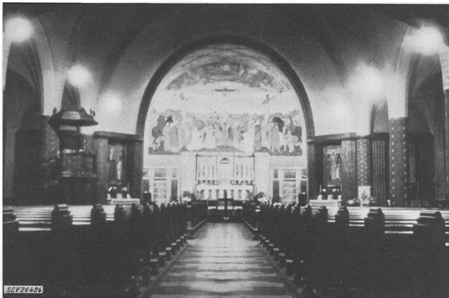
Fig. 6 St.-Pauls-Kirche

Gleichmässigkeit der Lichtverteilung ist gut.