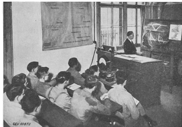
Fig. 1. Theoriestunde

ärgert, benützten die Handwerker oft nur noch zur Not die Elektroschweissapparate. Ein gewisses Misstrauen gegen dieses Schweissverfahren wollte Platz greifen. Diese Erscheinung war dem Umstand zuzuschreiben, dass der Maschinenverkäufer dem Benutzer in einem kurzen Vorführungsschweissen den Apparat wohl erklärt und vordemonstriert hatte, dann aber blieb der Käufer sich selbst überlassen. Je nach Können oder Selbststudium konnte er nun den teuer gekauften Apparat mehr oder weniger gut anwenden. Schweissen muss man lernen und lehren, und zwar nicht vom Nebenmann, der oft auch keine methodische Anleitung erfahren hat.