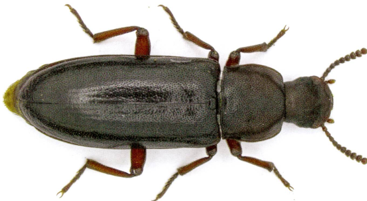
Fig. 1. Habitus du spécimen de Bius thoracicus (7.1 mm) collecté le 5.10.2016.