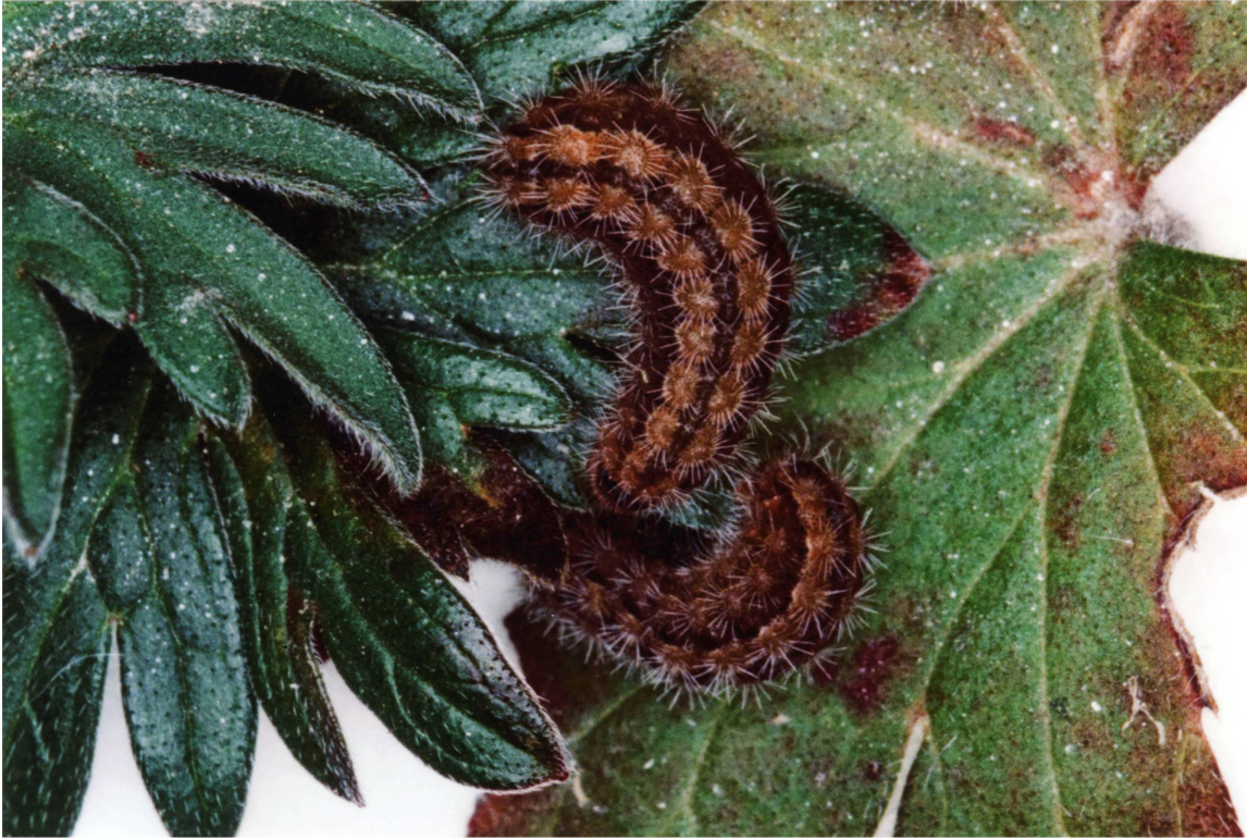
Abb. 3. Erwachsene Raupen (Dorsalseite) von A. dujardini vom Typenfundort (Zucht 2014/2015; Italien: Provinz Macerata, Monte San Vicino, Pian dell'Elmo).