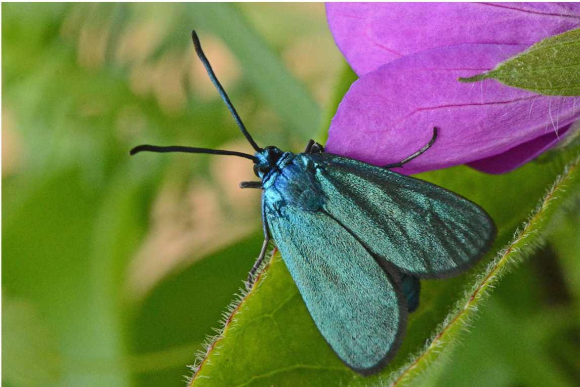
Abb. 9. Weibchen von A. dujardini (Zucht 2014/2015; Population Eggerberg).