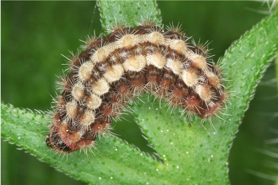
Abb. 5. Erwachsene Raupe (Dorsalseite) von A. dujardini aus dem Wallis (Zucht 2014/2015; Population Eggerberg).