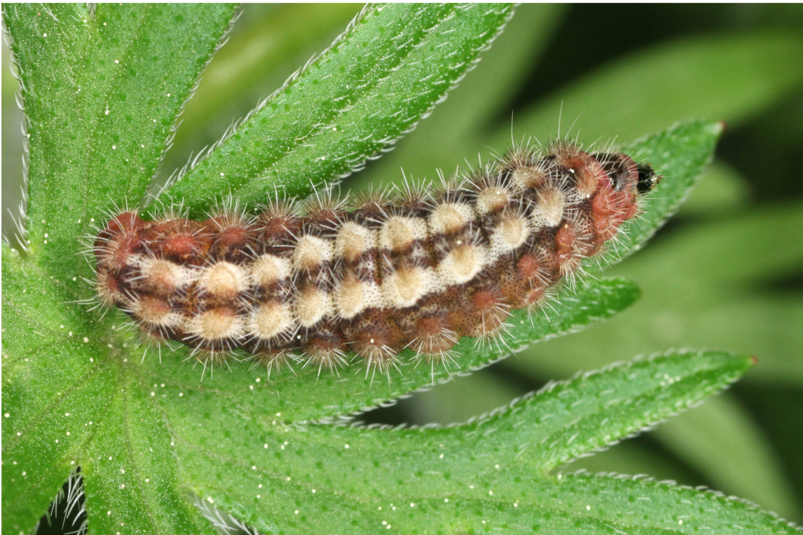
Abb. 4. Erwachsene Raupe (Dorsalseite) von A. dujardini aus dem Wallis (Zucht 2014/2015; Population Eggerberg).