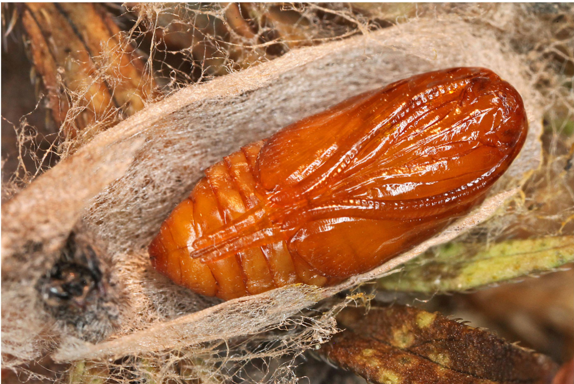
Abb. 8. Puppe (Ventralseite) und Puppengespinnt von A. dujardini aus dem Wallis (Zucht 2014/2015; Population Eggerberg).