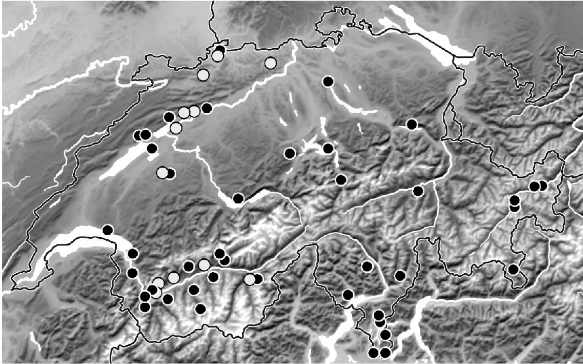
Abb. 9. Karte der Schweiz mit allen überprüften Funden von Cryptocephalus bameuli Duhaldeborde, 1999 (weisse Punkte) und C. flavipes Fabricius, 1781 (schwarze Punkte).

Matern, H.D. & Siede, D. 2001. Cryptocephalus bameuli Duhaldeborde 1999 – eine neue mitteleuropäische Blattkäferart auch im Rheinland. — Mitteilungen der Arbeitsgemeinschaft Rheinischer Koleopterologen (Bonn) 11: 29–32.