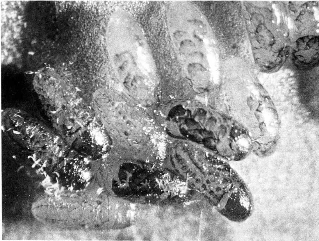
Fig. 2: Larven von Gastroidea viridula kurz vor dem Schlüpfen.

Anschliessend wurden sie mit unbehandelten Geschlechtspartnern verpaart und zur Eiablage auf unbehandelte Pflanzen gebracht. In Abständen von 1-3 Tagen wurden die Eigelege entfernt und das Schlüpfen der Larven kontrolliert. Wie Tab. 5 zeigt, konnte nach Behandlung der Männchen keine Erhöhung der Sterblichkeit in der Nachkommenschaft festgestellt werden. Nach Behandlung der Weibchen jedoch schlüpften in den ersten 4 Tagen nach Behandlungsende keine Larven. Dabei waren durch die Eihülle deutlich die voll entwickelten L_1 -Larven sichtbar (Fig. 2), welche aber die Eihülle nicht durchbrechen konnten. Grundlage der oviziden Wirkung von Dimilin dürfte auch bei G. viridula die verminderte Einlagerung von Chitin in die Endokutikula des ersten Larvenstadiums sein, was zur Unfähigkeit führt, die Eihülle zu durchbrechen. Wie oben bereits erwähnt, findet sich dieser charakteristische Effekt von Dimilin bei mehreren anderen Insektenarten. Eine letale Störung der frühen Embryogenese, wie sie HOLST (1975) beim mexikanischen Bohnenkäfer E. varivestis nachwies, konnten wir für G. viridula auch mit einer Erhöhung der Dimilinkonzentration auf 0.2% und 0.5% nicht feststellen.