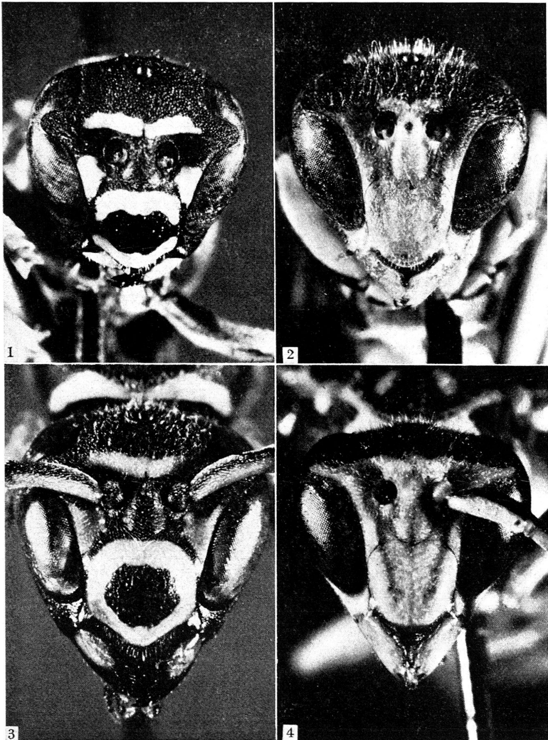
Fig. 1. — Polistes bischoffi WEYRAUCH ♀, capo.