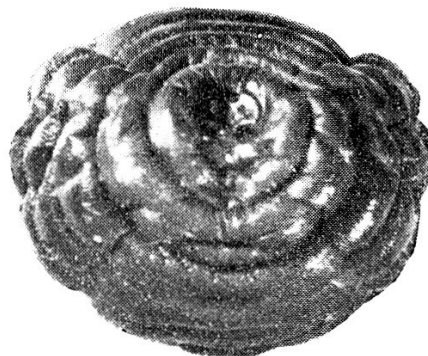
Fig. 3. — Hinterende der Larve mit den charakteristischen Stigmenplatten der Adultlarve.

Als wesentlicher Unterschied der beiden Formen scheint mir auch der Ort der Einbettung der Larven unter der Haut zu sein bei satyrus in der