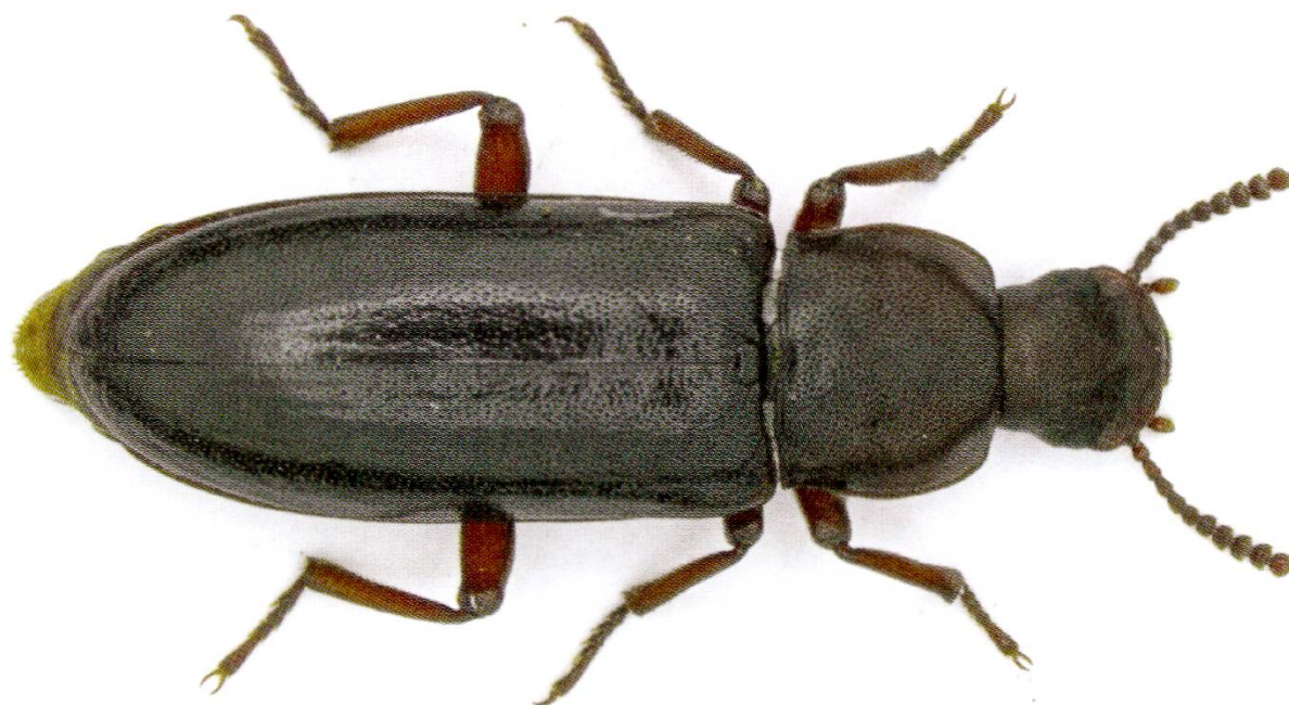
Fig. 1. Habitus du spécimen de Bius thoracicus (7.1 mm) collecté le 5.10.2016.