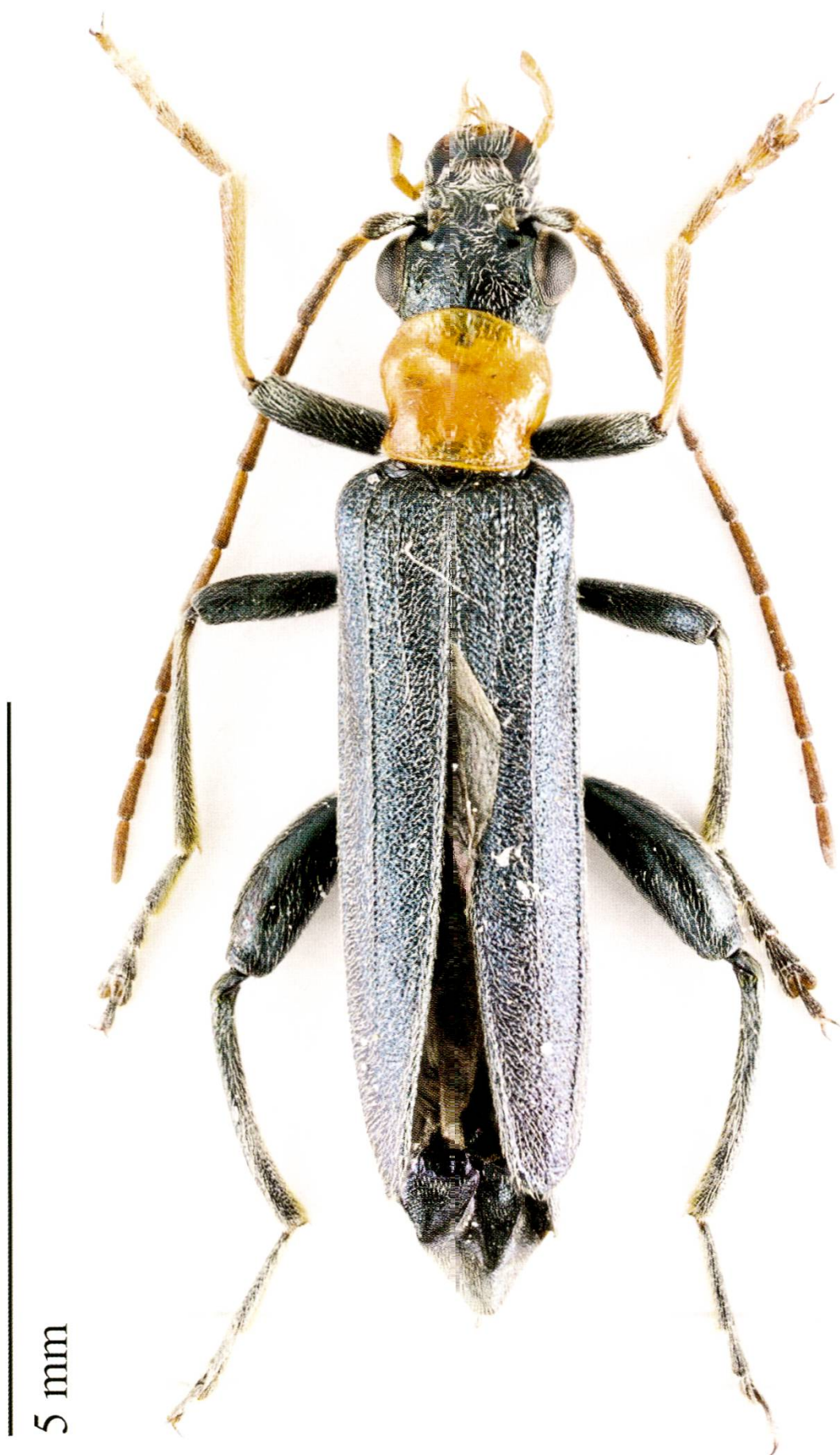
Fig. 1. Oedemera croceicollis : mâle, Helv., VD, Le Lieu, 17.VI.2015.