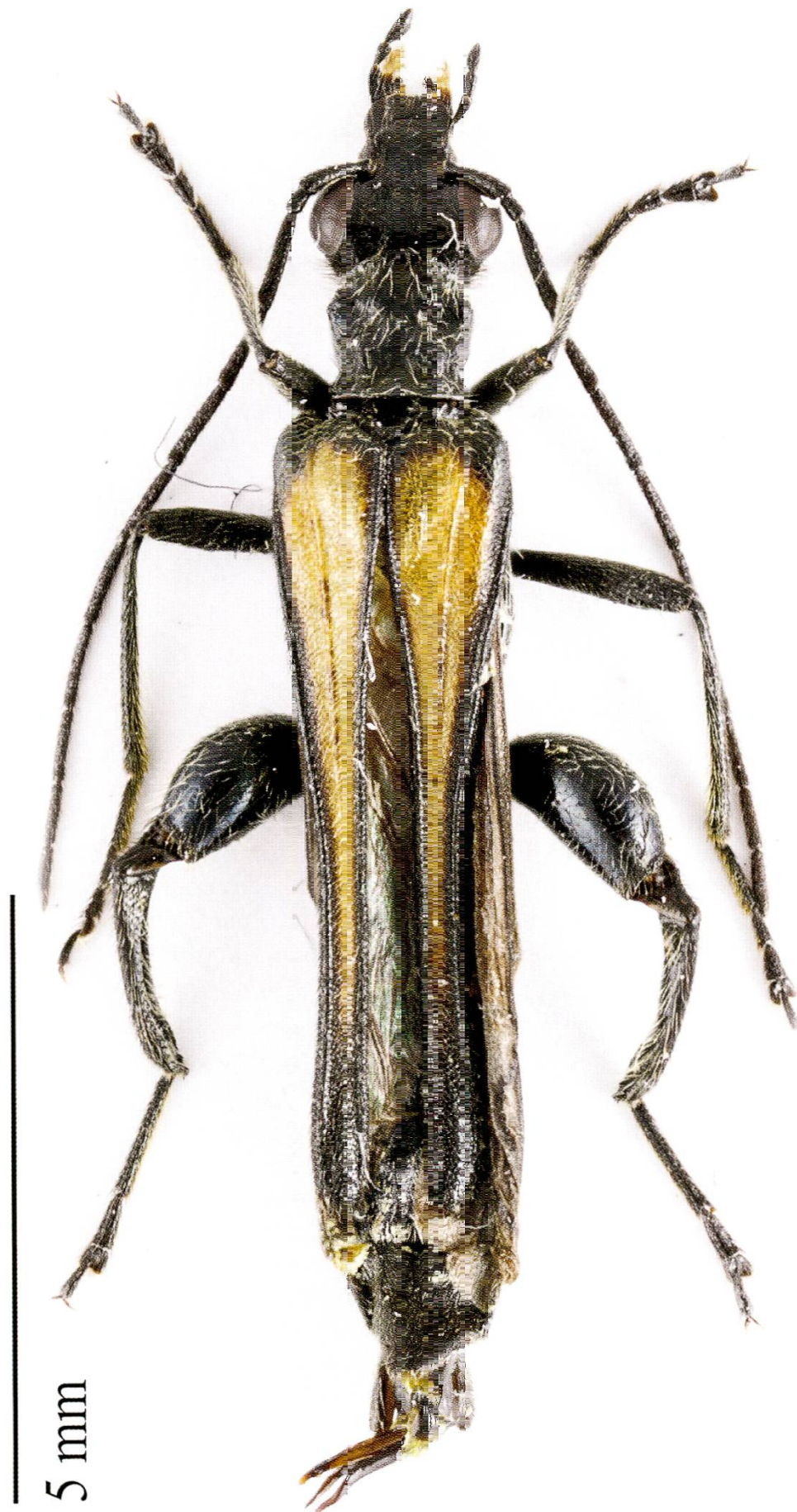
Fig. 4. Oedemera pthysica : mâle, Helv., BL, Dittingen, 13.VI.2015 (photo A. Sanchez).