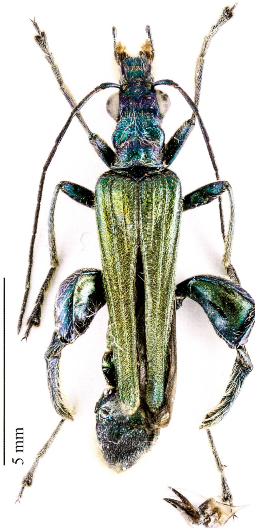
Fig. 3. Oedemera nobilis : mâle, Helv., TI, Mendrisio, 14.V.2014.