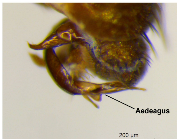
Abb. 2. Chrysotus gramineus (Fallén, 1823), Männchen, Postabdomen.