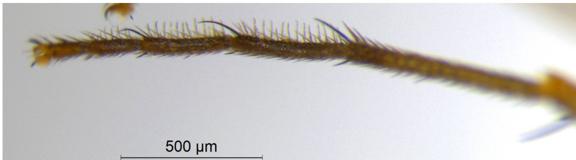
Abb. 5. Dolichopus cilifemoratus Macquart, 1827, Männchen, Vordertarsen.

durch das Vorhandensein einer «gebrochenen vierten Längsader» unterschieden werden kann und kommt zum Schluss: «... aber eine Identität kann man mit Überzeugung nicht aussprechen.» Auch im Schlüssel (Becker, 1917: 172) wird D. occultus nur durch das Vorhandensein einer stub-vein («vierte Längsader rechtwinklig gebrochen») von den beiden anderen Arten unterschieden. Auch Stackelberg (1933: 77) schreibt zu dieser Art: «Mir unbekannt und etwas zweifelhaft geblieben.» D. arbustorum und D. salictorum hingegen unterscheiden sich deutlich durch die Färbung des dritten Fühlergliedes, welches bei ersterer zum Teil gelb ist, während dieses bei letzterer ganz schwarz ist. Eine Untersuchung von D. occultus ist nicht möglich, da die Staegerschen Typen anscheinend nicht mehr vorhanden sind (Becker 1917: 130). Aufgrund des Nachweises der innerartlichen Variabilität des Vorhandenseins einer stub-vein der Ader M schlage ich hiermit vor, Dolichopus occultus mit Dolichopus arbustorum zu synonymisieren.