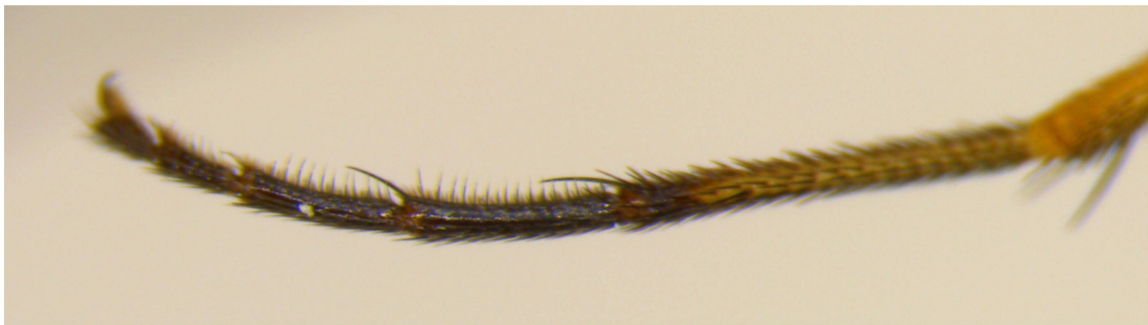
Abb. 6 Dolichopus festivus Haliday, 1832, Männchen, Vordertarsen.