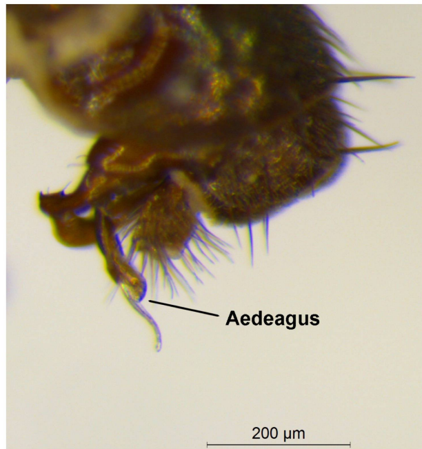
Abb. 1. Chrysotus collini Parent, 1923, Männchen, Postabdomen.