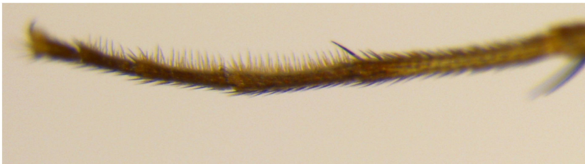
Abb. 7. Dolichopus trivialis Haliday, 1832, Männchen, Vordertarsen.