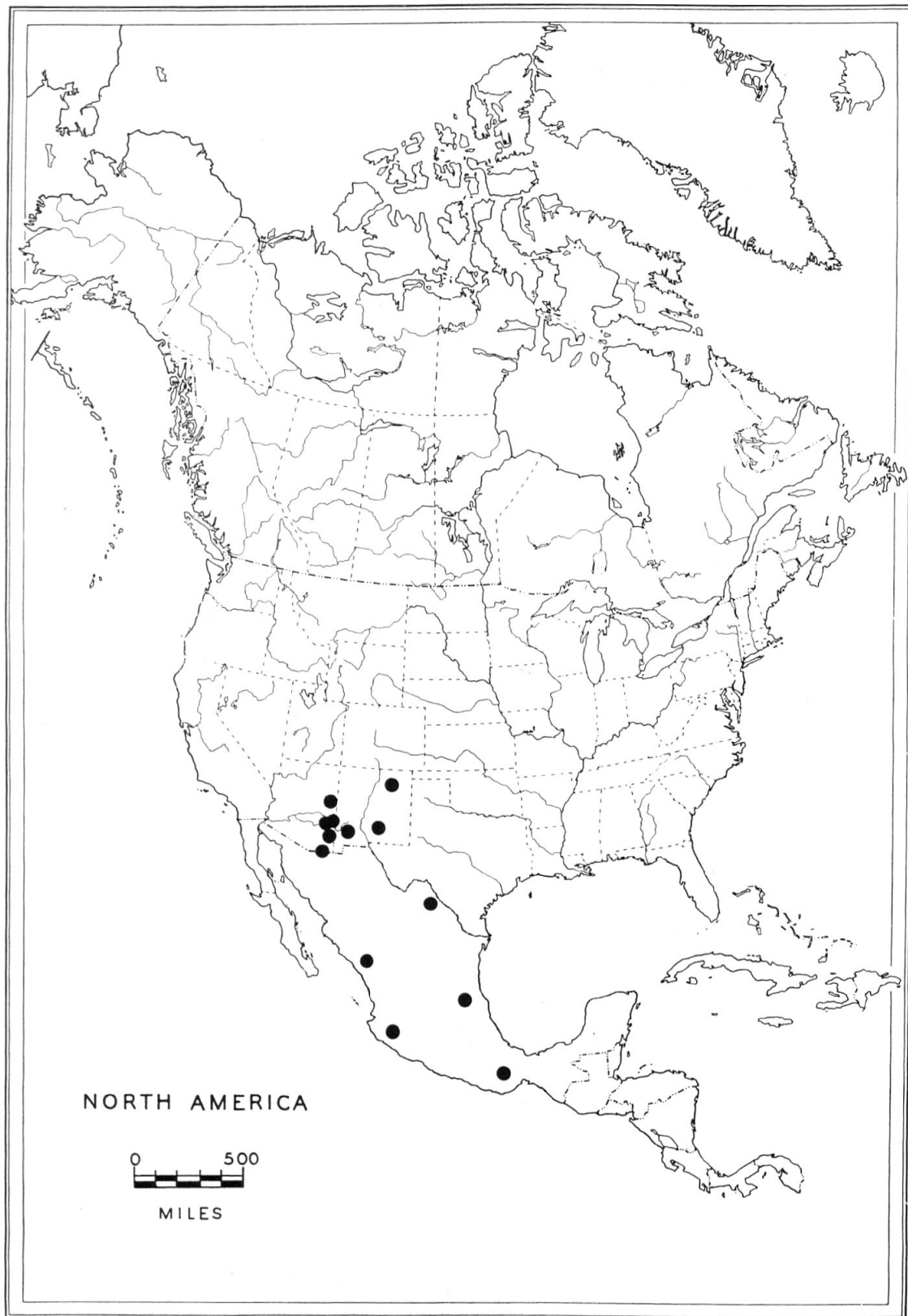
Fig. 6: Distribution de Nycteus falsus .