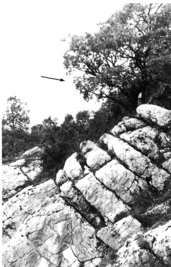
Fig. 2: Situation du piège dont l'emplacement est indiqué par la flèche.