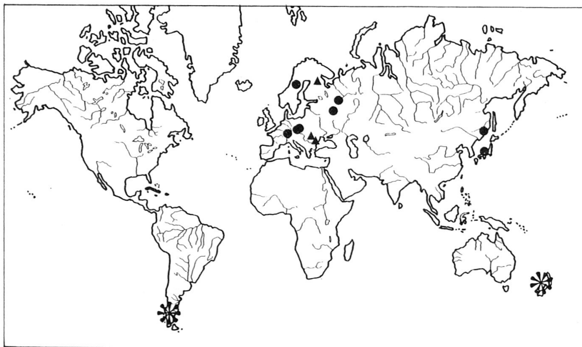
Fig. 3: Répartition des Canthyloscelidae dans le monde. ● Hyperoscelis eximia (Boh.), ▲ H. veternosa MAM. & KRIV., * genre Canthyloscelis .