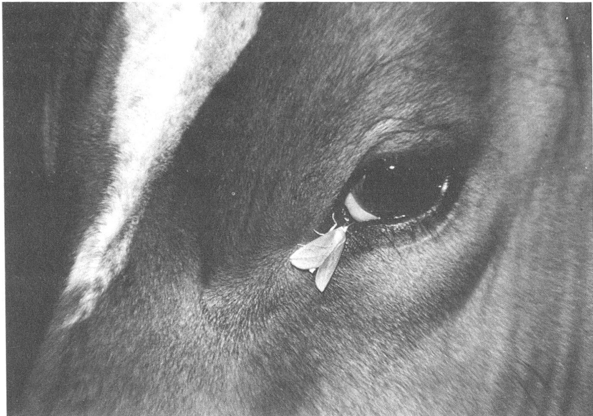
Fig. 2 Arcyophora patricula Hspn. en aspirant du liquide lacrymal d'une vache. Bouaké (Côte d'Ivoire)