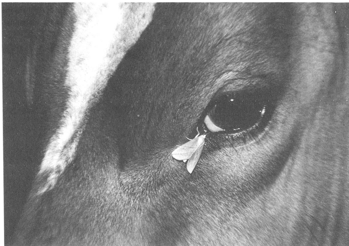
Fig. 2 Arcyophora patricula Hspn. en aspirant du liquide lacrymal d'une vache. Bouaké (Côte d'Ivoire)