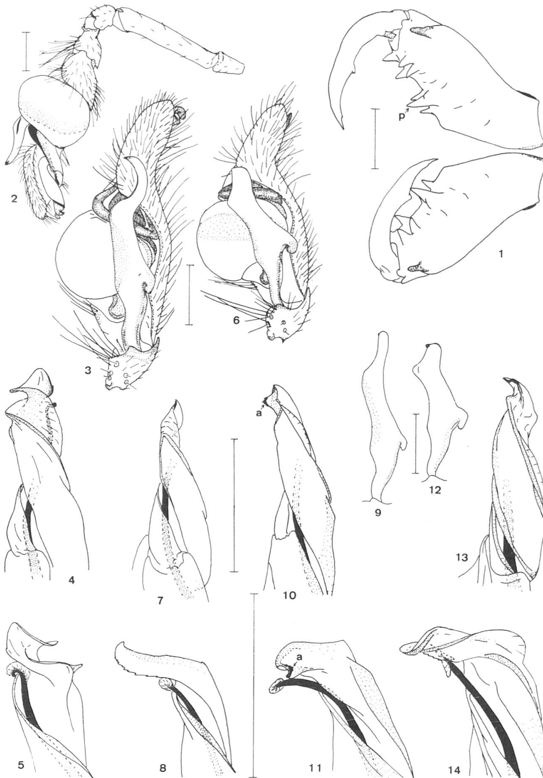
Fig. 1–5, Pachygnatha simoni n. sp., ♂: 1, chélicères. — 2, palpe maxillaire gauche, vue externe. — 3, id., bulbe et paracymbium, vue interne. — 4, extrémité du conducteur gauche, vue externe. — 5, id., vu de dessous. — Fig. 6–8, P. bonneti n. sp., ♂: 6, bulbe et paracymbium gauche, vue interne. — 7, extrémité du conducteur gauche, vue externe. — 8, id., vu de dessous. — Fig. 9–11, P. sundevalli n. sp., ♂: 9, paracymbium gauche, vue interne. — 10, extrémité du conducteur gauche, vue externe. — 11, id., vu de dessous. — Fig. 12–14, P. tullgreni n. sp., ♂: 12, paracymbium gauche, vue interne. — 13, extrémité du conducteur gauche, vue externe. — 14, id., vu de dessous. — Témoins d'échelle = 0,5 mm.