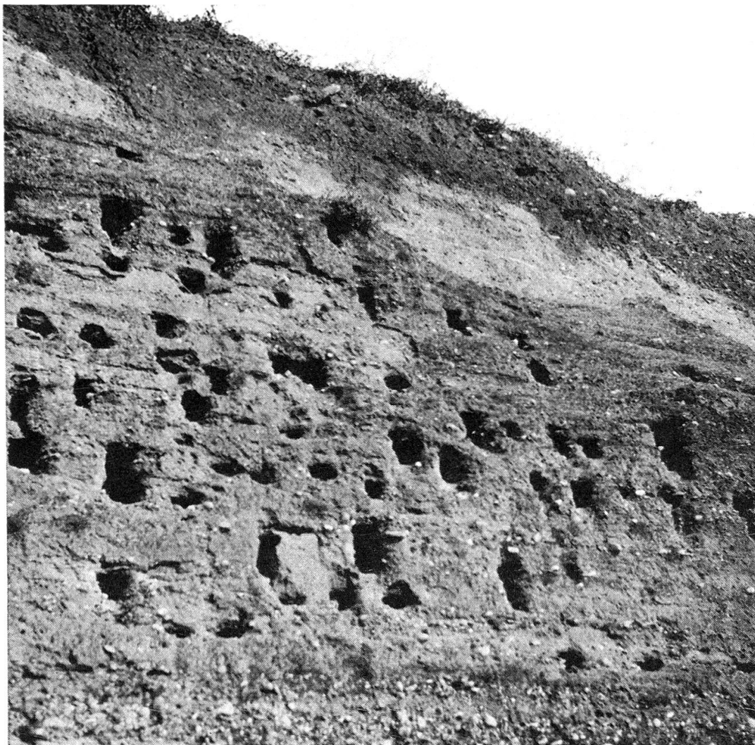
Abb. 2. — Teilansicht der Uferschwalbenkolonie in Ins (Kt. Bern) — Dez. 1965.