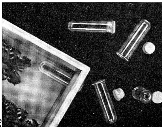
Fig. 2. — Schleusen-Röhrchen mit zugehörigen Pilzkorken vor und nach dem Einbau.