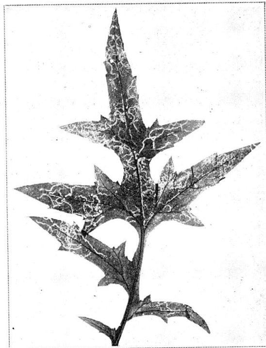
Fig. 1. Galeries creusées dans la feuille d' Echinops humilis par les larves de Phytomyza echinopis Her.

3. Phytomyza echinopis Her., parasite de l' echinops humilis . Les larves mineuses des mouches appartenant à la famille des Agromyzidae sont pour les cultivateurs des ennemis fort dangereux. Les particularités de leur biologie rendent souvent difficile la lutte directe si l'on ne veut pas faire subir à la plante parasitée de graves dommages. Nous avons signalé l'existence à Genève de quelques diptères mineurs dont les dégâts ont une importance économique considérable. A la liste de ces déprédateurs que nous avons publiée ailleurs, il y a lieu d'ajouter Phytomyza echinopis Her.