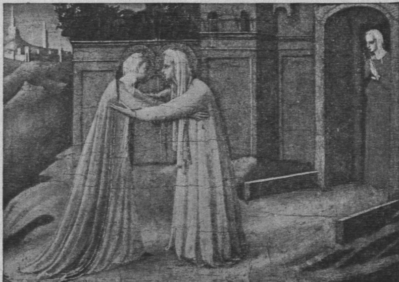
18B Maria besucht Elisabeth Fra Angelico

Bestellungen sind zu richten an das Sekretariat der IMK, Postfach 162 A, 6301 Zug.