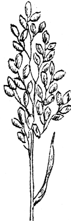
Reisispe mit reifen Körnern.

Pflege. Zieht ein Gewitter herauf, wird das Reisfeld unter Wasser gesetzt, damit der jungen Saat ein Hagel nicht schade. In kurzer Zeit wächst der Reis heran zu einer Höhe