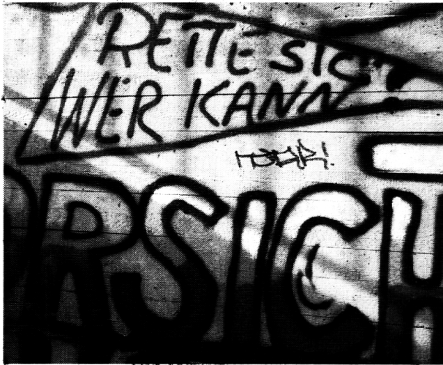
Graffiti in einer Unterführung in Schwamendingen – zeitgemässe Parolen

jedoch sicher um erschreckende Erfahrungen. Man stelle sich nur vor: Jemand muss ein ganzes Schülerleben lang mit Angst in die Schule gehen!