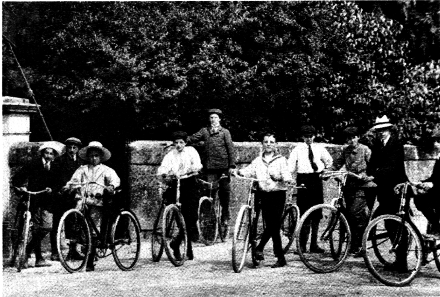
Schüler und Lehrer des Instituts Grüneau unternahmen jedes Jahr längere Velotouren. 1903 reiste man in die Ostschweiz und ins Bündnerland während 21 Tagen: total 1107 Kilometer. Die Tageshöchstleistung betrug stolze 106 km!

des spanischen Libertären und Schulkämpfers Francisco Ferrer fussend, ist diese Schule in der Geschichte der Pädagogik in der Schweiz ein Unikum geblieben. Am 1. November 1910 eröffnet die aus Arbeiterlehrern und Gewerkschaftern zusammengesetzte «Société de l'Ecole Ferrer» in Chailly bei Lausanne mit 28 Kindern die «Ecole Ferrer». Ihr Ziel: Dort sollen zukünftige, klarblickende, ihrer Klasse bewusste Arbeiter erzogen werden. Darum bemüht sich die «Ecole», «die physischen Kräfte, den Willen und den Weitblick der ihr anvertrauten Kinder zu entwickeln. Unterricht soll konkret, praktisch, lebendig und koedukativ» (in allen Fächern; vgl. «Aus der Schulgeschichte der Schweiz», Nr. 5) sein; Hausaufgaben, Strafen und Belohnungen sind verboten; alle moralische Beeinflussung wird abgelehnt; an die Interessen und den Elan des Kindes soll immer appelliert werden; die Eltern und andere Berufsleute sind zur Mitarbeit aufgerufen.