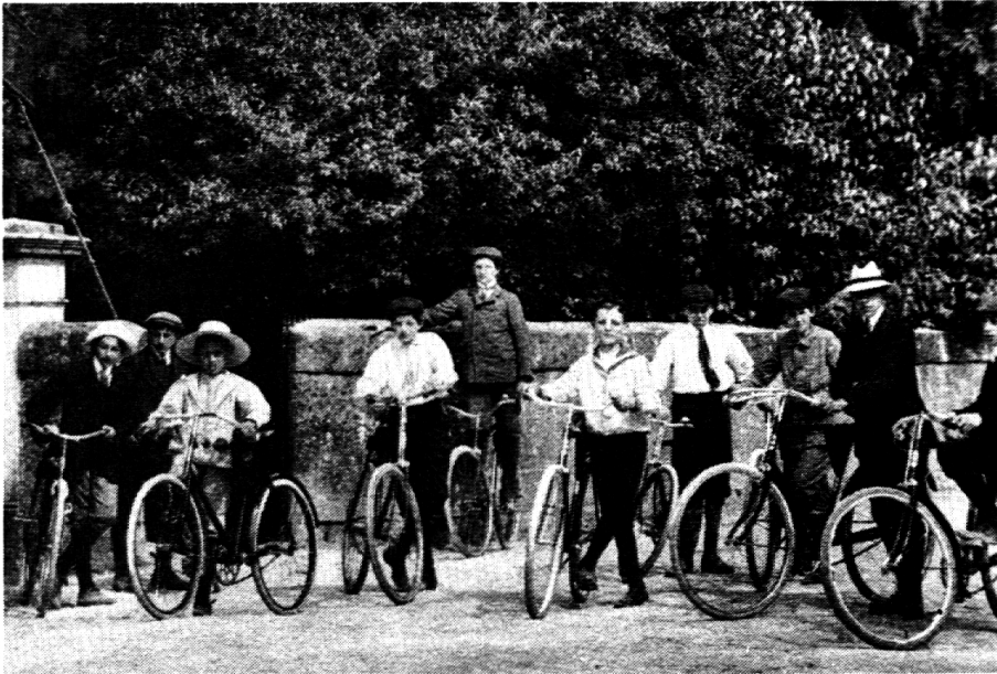
Schüler und Lehrer des Instituts Grünaun unternahmen jedes Jahr längere Velotouren. 1903 reiste man in die Ostschweiz und ins Bündnerland während 21 Tagen; total 1107 Kilometer. Die Tageshöchstleistung betrug stolze 106 km!

des spanischen Libertären und Schulkämpfers Francisco Ferrer fussend, ist diese Schule in der Geschichte der Pädagogik in der Schweiz ein Unikum geblieben. Am 1. November 1910 eröffnet die aus Arbeiterlehrern und Gewerkschaftern zusammengesetzte «Société de l'Ecole Ferrer» in Chailly bei Lausanne mit 28 Kindern die «Ecole Ferrer». Ihr Ziel: Dort sollen zukünftige, klarblickende, ihrer Klasse bewusste Arbeiter erzogen werden. Darum bemüht sich die «Ecole», «die physischen Kräfte, den Willen und den Weitblick der ihr anvertrauten Kinder zu entwickeln. Unterricht soll konkret, praktisch, lebendig und koedukativ» (in allen Fächern; vgl. «Aus der Schulgeschichte der Schweiz», Nr.5) sein; Hausaufgaben, Strafen und Belohnungen sind verboten; alle moralische Beeinflussung wird abgelehnt; an die Interessen und den Elan des Kindes soll immer appelliert werden; die Eltern und andere Berufsleute sind zur Mitarbeit aufgerufen.