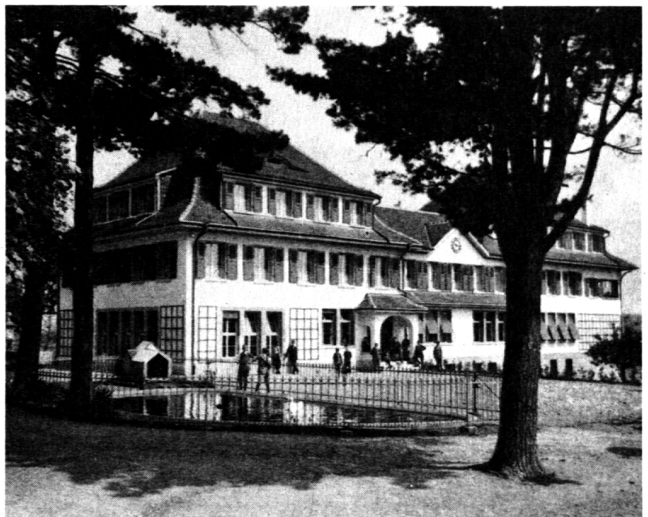
Das Institut Grünau in Wabern-Bern wandelte sich ab 1896 unter der neuen Leitung von Huldreich Looser zu einem Landerziehungsheim.

Eine anarchistische Alternative ist die «Ecole Ferrer» in Lausanne (Grunder 1886). Auf den Ideen