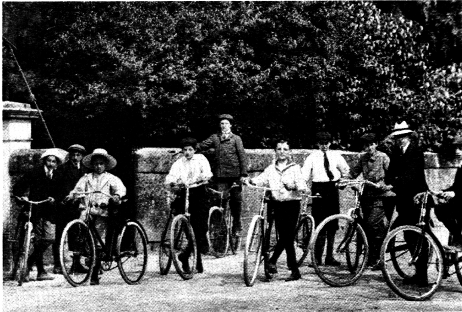
Schüler und Lehrer des Instituts Grünuu unternahmen jedes Jahr längere Velotouren. 1903 reiste man in die Ostschweiz und ins Bündnerland während 21 Tagen: total 1107 Kilometer. Die Tageshöchstleistung betrug stolze 106 km!

des spanischen Libertären und Schulkämpfers Francisco Ferrer fussend, ist diese Schule in der Geschichte der Pädagogik in der Schweiz ein Unikum geblieben. Am 1. November 1910 eröffnet die aus Arbeiterlehrern und Gewerkschaftern zusammengesetzte «Société de l'Ecole Ferrer» in Chailly bei Lausanne mit 28 Kindern die «Ecole Ferrer». Ihr Ziel: Dort sollen zukünftige, klarblickende, ihrer Klasse bewusste Arbeiter erzogen werden. Darum bemüht sich die «Ecole», «die physischen Kräfte, den Willen und den Weitblick der ihr anvertrauten Kinder zu entwickeln. Unterricht soll konkret, praktisch, lebendig und koedukativ» (in allen Fächern; vgl. «Aus der Schulgeschichte der Schweiz», Nr. 5) sein; Hausaufgaben, Strafen und Belohnungen sind verboten; alle moralische Beeinflussung wird abgelehnt; an die Interessen und den Elan des Kindes soll immer appelliert werden; die Eltern und andere Berufsleute sind zur Mitarbeit aufgerufen.