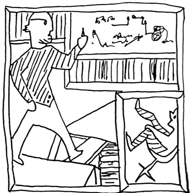
Die Rollen sind fixiert: Überverantwortlicher und Unterverantwortlicher.

3. Spielzug: Je nachdem wie rasch ich mich erhole, wechsle ich aus der «Opfer»-Rolle in die «Verfolger»-Rolle: ich drohe den Schülern mit Proben und mit Rückversetzungen, mit Zuwendungs-Entzug und mit Strafen. Die Schüler reagieren mit Angst und wechseln von «Rettern» zu «Opfern».