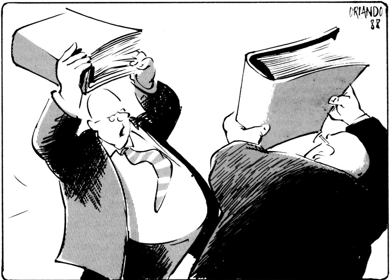
Bildungsstreit (Oder: «Laien contra Profis»)

Schlechte Noten erhält insbesondere die «lokale Laienkontrolle» in der Schweiz, welcher eine professionalisierte und am Beamtentum organisierte Fachaufsicht in Deutschland gegenübergestellt wird. Denn der starke Einfluss von Laien sei eher ein Hindernis, wenn es darum gehe, neue Tech-