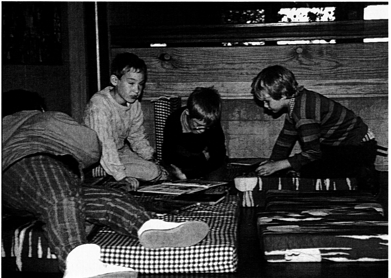
Die Lesecke wurde zum Dreh- und Angelpunkt der Buchwoche.

zusammengestellt, die in Vitrinen präsentiert wurden – also nichts zum Anfassen, aber zum Ansehen und Appetitmachen. Hier wurden andere Gespräche geführt: Kleine Experten berieten die noch kleineren Mitschüler, stolze Buchbesitzer entdeckten Bekanntes wieder und mussten das unbedingt möglichst vielen Leuten mitteilen (und zwar sofort), Buchwünsche wurden geweckt und den Eltern mitgeteilt, Vermutungen über den Inhalt von Büchern, die da aufgeschlagen lagen, wurden angestellt.