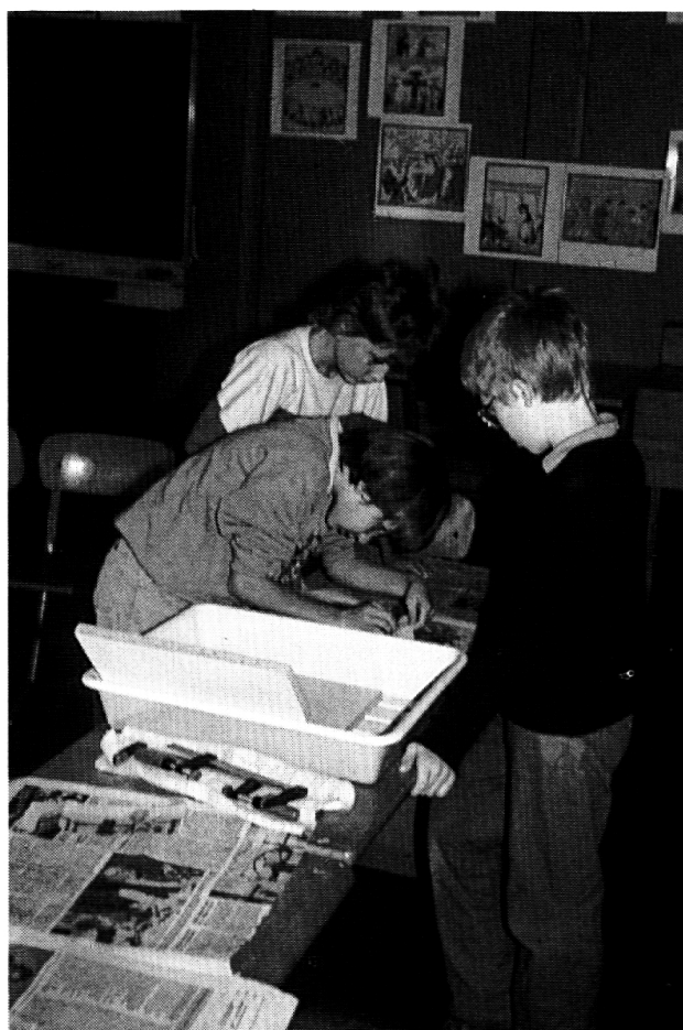
In der Druckerwerkstatt wird fleissig gearbeitet.

Da man im Deutschunterricht gerade damit beschäftigt war, Bücher in Kurzform vorzustel-