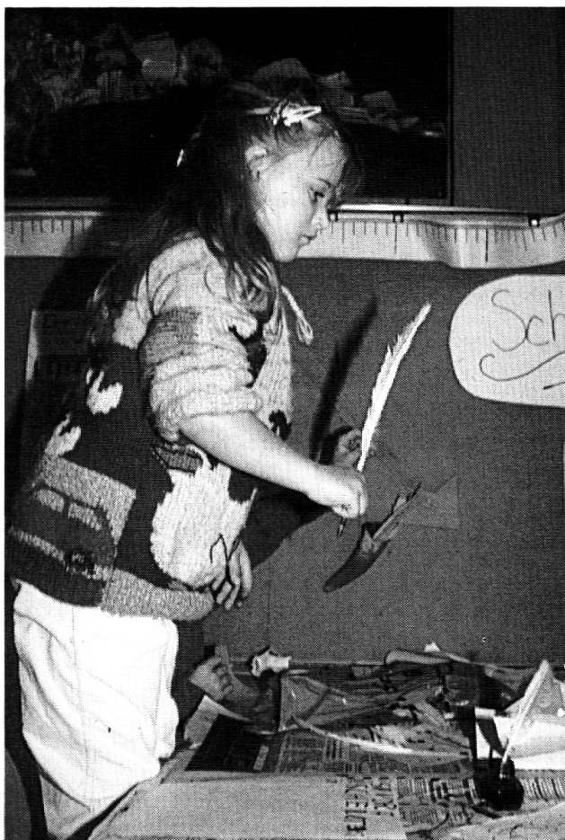
Schreiben als Kunst.

waren. Und viele Kinder holten ihre Eltern zu diesem Plakat, um Fremdsprachenkenntnisse abzufragen und neu erworbenes, eigenes Wissen zu demonstrieren.