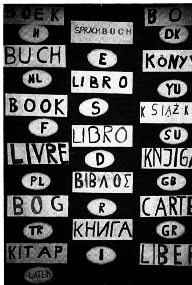
Ein Hauch von Internationalität!

Schliesslich malte jedes Kind «sein» BUCH-WORT auf ein A5-Blatt und fügte in Form von Zeichnungen, Karten oder Gegenständen eine «Illustration» hinzu. So entstand ein weiteres Ausstellungsplakat.