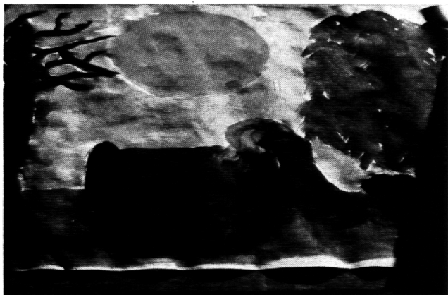
Die Gänsehirtin, die sich im Lichte des Vollmondes am Brunnen wäscht. Grossformatiges Blatt mit Fingerfarben von Frau A.C.

Am dritten Abend versuchten wir den handelnden Figuren auf die Spur zu kommen. Zu zweit spürten wir nach dem Wesen der Hexe , des alten Königspaares , des Jünglings und der jüngsten Königstochter . Die beiden Männer der Gruppe getrauten sich sogar, die Typen pantomimisch darzustellen!