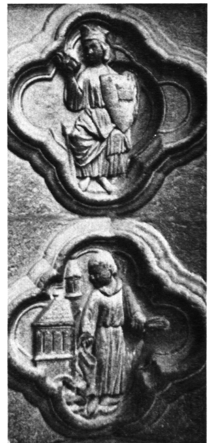
Beharrlichkeit und Unbeständigkeit

«schweizer schule» 9/1985!) auf und setzt sich mit ihr kritisch auseinander. Was das Buch von Fend aber besonders attraktiv macht, ist die Konfrontation neokonservativer Thesen mit empirischen Forschungsergebnissen zur praktischen Wirksamkeit konservativer Mentalität – etwa in der Lehrerschaft – und mit neueren Erkenntnissen der Schulklima- und Schulwirkungsforschung. Das Buch ist ebenfalls nicht gerade leicht geschrieben, liest sich aber im zweiten Teil wie ein spannender Krimi – wenn man gelernt hat, sich von Korrelationstabellen nicht ablenken zu lassen.