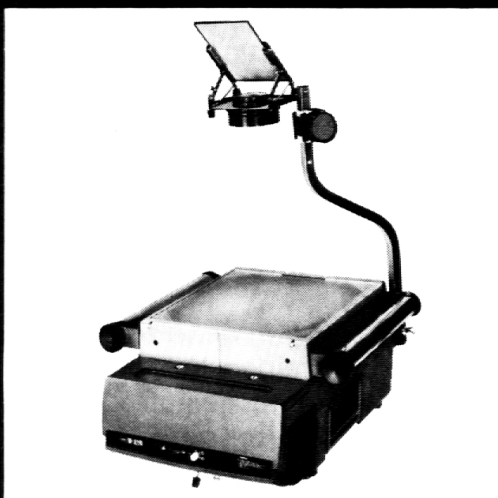
ELMO Tageslichtprojektor HP-A270

In einem modernen formschönen Gehäuse präsentiert sich der neue Tonprojektor Elmo 16-AL. Die einzigartige «Film-Einfädel-Automatik» erlaubt auch von Ungeübten ein rasches und sicheres Filmeinlegen. Vor- und Rückwärtsprojektion, Lampen Ein- und Ausschaltung, Pause und Stop gehören zum Standard. Diese Funktionen sind auch mit einem, als Zubehör lieferbaren, Fernbedienungskabel von 8 m Länge, steuerbar. Ein Elmo 1:1.2/50 mm Standard-Objektiv in Verbindung mit einer 24V/250W Halogenlampe sorgen für ein helles scharfes Projektionsbild.