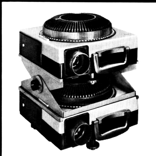
ELMO Diaprojektor Omnigraphic 250

Ein automatischer Projektor für 5 x 5 Dias, für den professionellen Einsatz – zur Informatik und Schulung. Robuste Technik im Aluminium-Spritzgehäuse, für handelsübliche Rundmagazine mit 80 und 140 Dias. Für Normal-, Endlos- und Überblendprojektion, für programmgesteuerte Tonbild- und Multivisionsschauen. Universell verwendbar durch die grosse Objektivpalette und ein umfangreiches Angebot an Steuergeräten, -systemen und Zubehör.