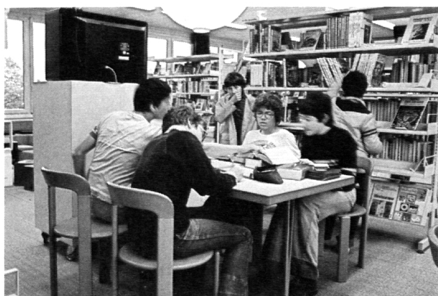
Gruppenarbeit in der Bibliothek

Aus Kontakten zwischen Autor und Leser können weitere Aktivitäten erwachsen, wie zum Beispiel die Bildung von Buchbesprechungsgruppen . Schüler verschiedener Klassen eines Schulhauses unter sich – vielleicht diskutieren Lehrer mit – befassen sich mit bestimmten Autoren oder Werken, vorzüglich mit Neuerscheinungen. Natürlich finden diese Gespräche in der Bibliothek statt, besonders dann, wenn Sitzstufen oder gemütliche Sesselgruppen zur Verfügung stehen. Die Ergebnisse werden schulintern bekanntgemacht, finden ihren Weg bis zu Autor und Verlag oder