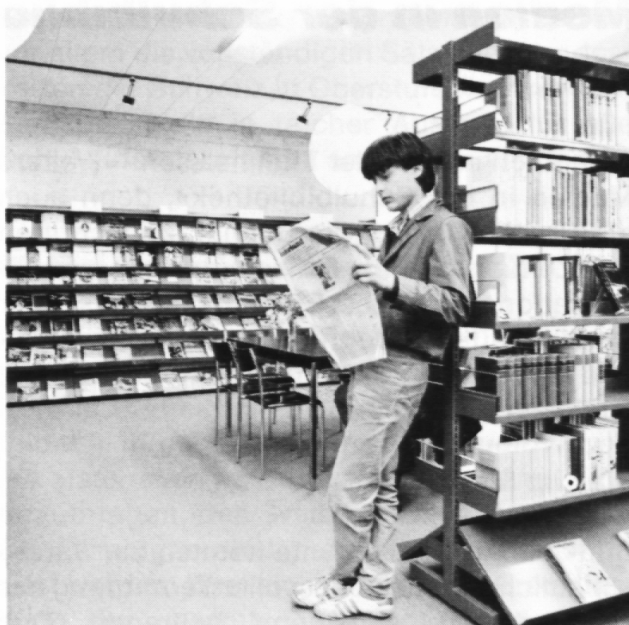
Reiches Zeitschriftenangebot in der Kantonsschule Luzern

Soll das Zeitschriftenangebot der eigenen Bibliothek attraktiv sein, gilt es sicher, die Leserwünsche zu berücksichtigen, diese aber der Forderung nach Qualität in Inhalt und Aufmachung unterzuordnen. Zudem werden in Bibliotheken für die Oberstufe der Volksschule oder besonders auch für Gymnasien oder Berufsschulen nicht nur ausgesprochene Jugendzeitschriften, 4 sondern Periodika aus den verschiedensten Bereichen anzubieten sein, vielleicht darunter die eine oder andere verhältnismässig kostspielige Publikation, die sich nicht jedermann selber abonnieren kann. In der folgenden Zusammenstellung seien einige Titel genannt, die in Schulbibliotheken