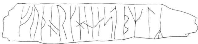
Ein Stück Knochen mit eingeschnitztem Alphabet FUTHARK.

Auf dem nachgezeichneten Stück Knochen sind diese ersten sechs Runen gut zu erkennen (Leserichtung: von links nach rechts). Für den Unterricht wird eine Mischform benutzt, die aus 22 Zeichen besteht, wobei für kurzes und langes E jeweils ein gesonder-tes Zeichen vorhanden ist und für C, QU, V, X und Y keine entsprechenden Zeichen vor- handen sind; sie müssen also durch andere, lautlich entsprechende Zeichen ersetzt wer- den. Dazu kann man leicht Vereinbarungen treffen (etwa CH=H, C=Z, QU=KW, V=F oder W, X=KS und Y=I oder J).