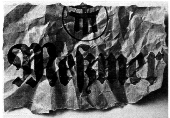
Beispiel einer Werbeanzeige – Anregung für 1. Beispiel

Das Fundstück, das in diesem Fall den Anstoss gab, ist eine Werbung, bei der ein hohes Alter einer Schrift dadurch vorgespiegelt wird, dass nur ein Fragment vorliegt und dass dieses Fragment gelitten hat (durch Zerkräuteln und Zerknittern).