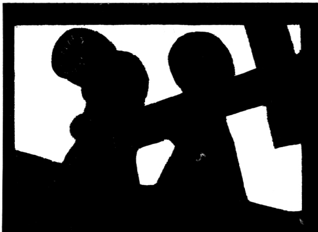
Simon hilft Jesus das Kreuz tragen

Während mit einzelnen Schülern ein Beispiel erarbeitet wird, sind die andern anderswie beschäftigt. Wichtig ist , dass nach dem Besprechen, Erleben, Betroffensein mit der Zeichnung sofort begonnen werden kann. Deshalb das Zeichnungsmaterial vorher schon bereitlegen.