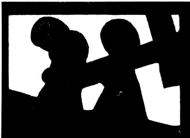
Simon hilft Jesus das Kreuz tragen

Während mit einzelnen Schülern ein Beispiel erarbeitet wird, sind die andern anderswie beschäftigt. Wichtig ist , dass nach dem Besprechen, Erleben, Betroffensein mit der Zeichnung sofort begonnen werden kann. Deshalb das Zeichnungsmaterial vorher schon bereitlegen.