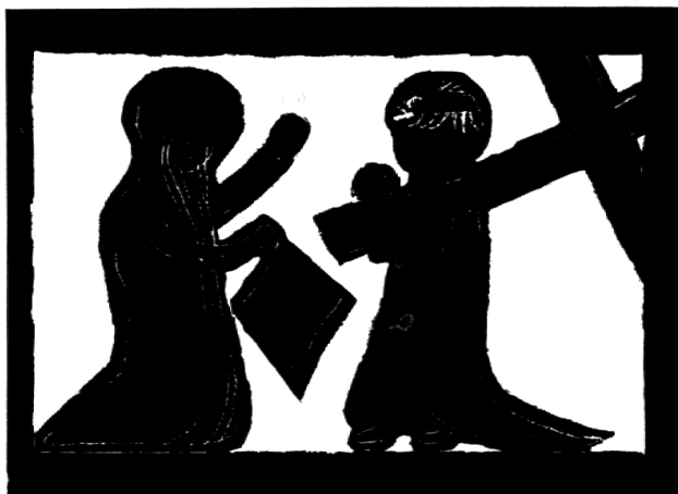
Veronika reicht Jesus das Schweisstuch