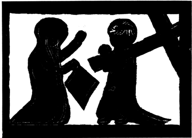
Veronika reicht Jesus das Schweisstuch