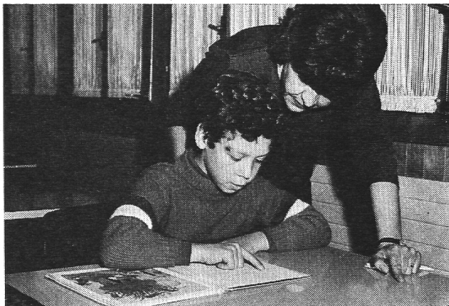
Aufgabenhilfe einzel ...

Es ist denn auch ein erstes und grosses Anliegen des Kantonalen Katholischen Frauenbundes Luzern geworden, die Frauen durch Kurzreferate und Diskussionen für die Schwierigkeiten des Fremdarbeiters zu sen-